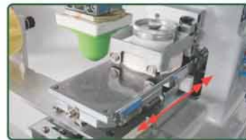
油杯平台前后推送运作 (自动清洁胶头收藏底部设计)