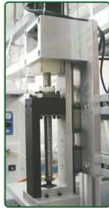
伺服马达胶头上/落