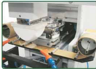
自动清洁胶头装置