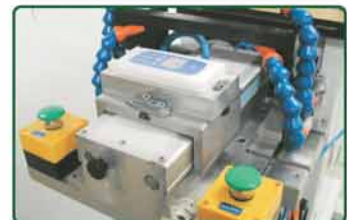
印刷产品自动推送位置