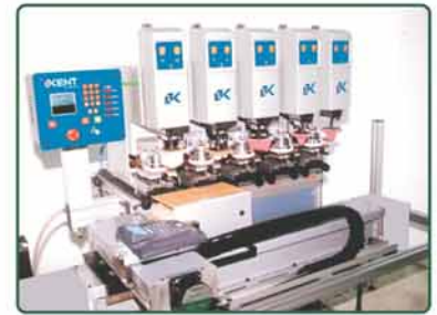
生产线上连动多色Alien机